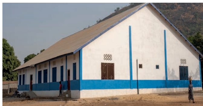
Salone complesso scolastico Conforti

Notiziario quadrimestrale Proprietà "Associazione Amici Sierra Leone" ONLUS Aprile 2020, Anno XIV, n° 2 Registraz. Tribunale di Parma N° 1/2007 del 29.1.2007 Direttore responsabile: BUSSONI MARIO Stampa Officina Grafica Cav. E. Gatti, Via Bertucci, 6 - Collecchio (PR)