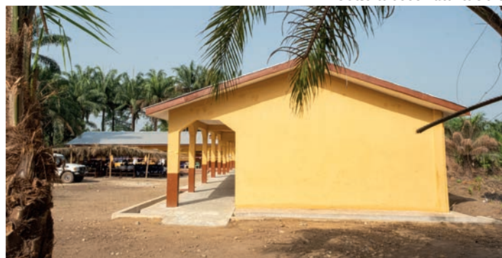
Scuola secondaria superiore St Andrew