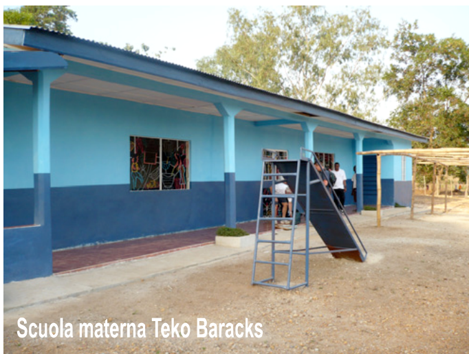
Scuola materna Teko Baracks