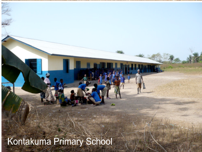
Kontakuma Primary School