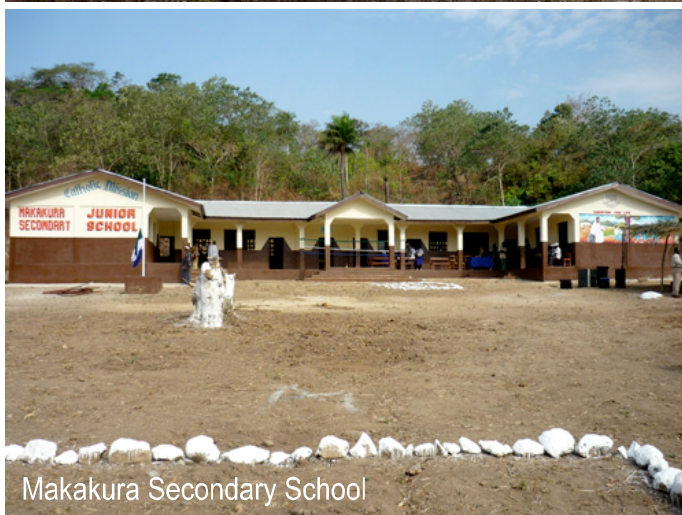
Makakura Secondary School

Applicare questo programma al popolo di una nazione come la Sierra Leone tuttora agli ultimi posti nella graduatoria mondiale dell'ONU, può essere sembrato a molti e per buona parte dei 26 anni di vita dell'Associazione soltanto un'utopia, o più semplicemente uno slogan, un sogno irrealizzabile per una piccola ma tenace Associazione come la nostra.