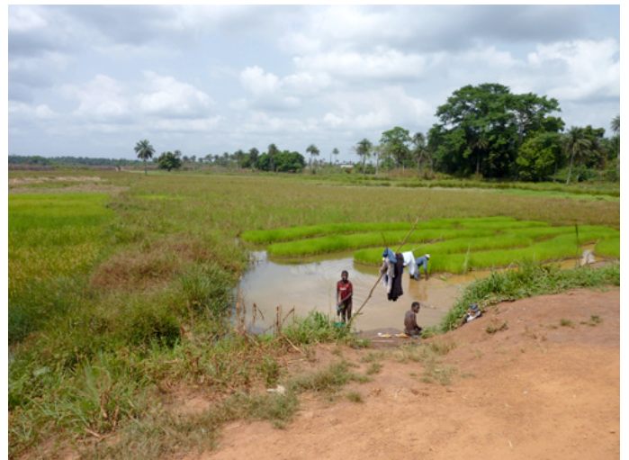
Attuale sistema di coltivazione del riso

In quella economia di semplice sussistenza il riso fino a poco tempo fa completava per gli abitanti un unico pasto al giorno, di norma consumato al pomeriggio.