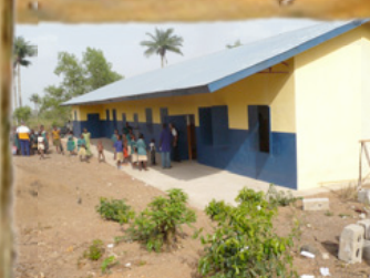
Scuola primaria di Mamassah