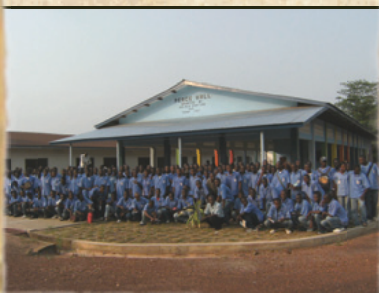
Salone multiuso scuola professionale St. Joseph Vocational Institute