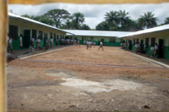
Scuola secondaria Stefani di Mabesseneh