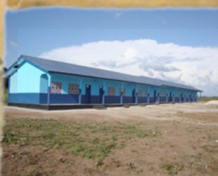
Scuola secondaria St. Andrew di Makeni Teko Road