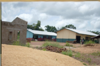
Villaggio artigianale "The Future" di Mabesseneh