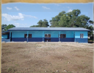
Scuola materna St. Andrew di Makeni Teko Road

..... realizzate da Voi con noi tutti insieme per la Sierra Leone