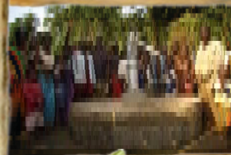
N° 9 POZZI DI ACQUA POTABILE